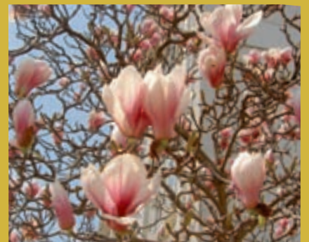
シモクレン(養護教育一号棟)

〒448-8542 愛知県刈谷市井ヶ谷町広沢1 法人運営課 広報室 電話:0566-26-2111 (案内)