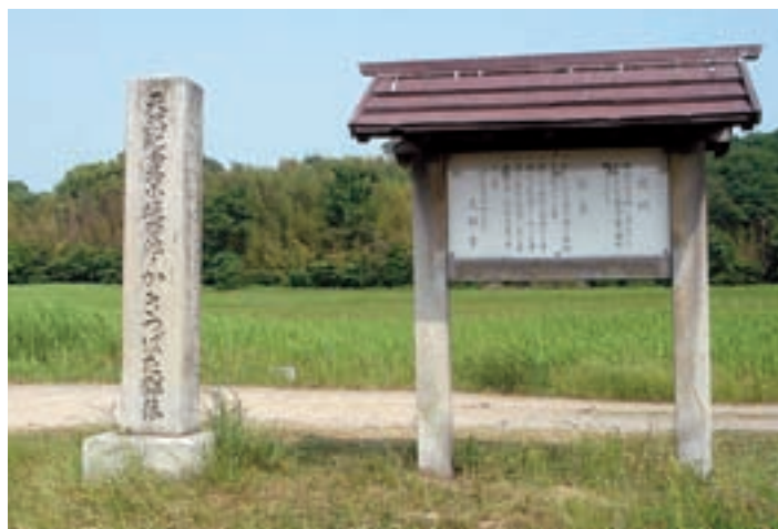
国指定天然記念物小堤西池のカキツバタ群落（井ヶ谷町小堤西） A view of Kozutsumi-Nishi Ike Pond covered with flowering irises (kakitsubata), a national monument