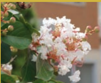
サルスベリ(附属図書館前広場)