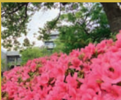
ツツジと第一人文棟