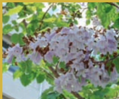
キリ(美術第一実習棟 渡り廊下)