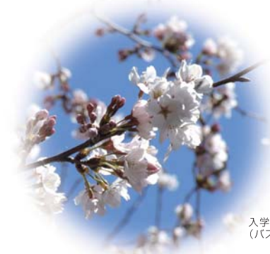
入学時に咲き誇る「ソメイヨシノ」 (バス停付近一帯)

全国でも数少ない「教員総合養成機関」としてだけでなく、社会の各分野で活躍できる人材を育成する大学として注目されている愛知教育大学。昨年度も全国各地の高等学校から多数の受験生が志願しています。