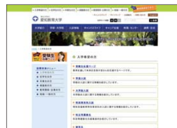
入学希望者用情報ページ