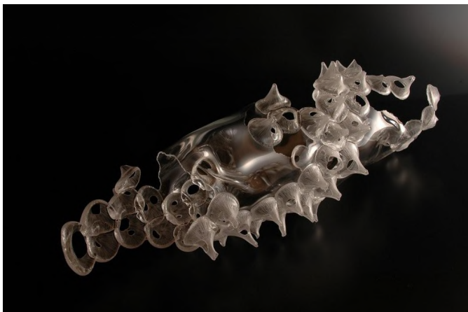
タイトル：臨界 1110 サイズ：27×87×27 cm 技法：宙吹き, エングレービング 制作：2011 年