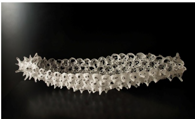
タイトル：転成 0815 サイズ：19×76×18 cm 技法：宙吹き, サンドブラスト 制作：2008 年