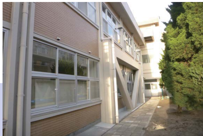
特別教室 Anti-earthquake reinforcement [ 耐震補強 ] 鋼板内蔵コンクリートブレース補強