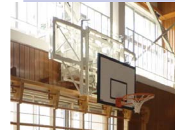
バスケットゴール落下対策