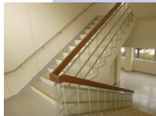
落下防止対策 ポリカーボネート新設