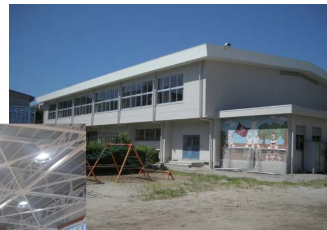
体育館 Anti-earthquake reinforcement [ 耐震補強 ] 内部鉄骨ブレース補強