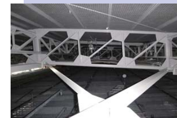
天井材落下防止ネット