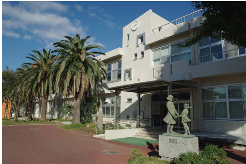
附属岡崎小学校 特別教室