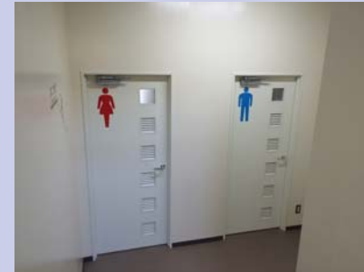
生徒用便所を新設