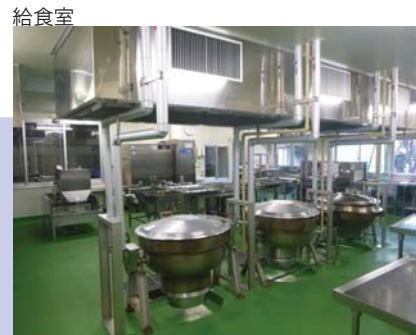
汚染区域、非汚染区域を設けた。