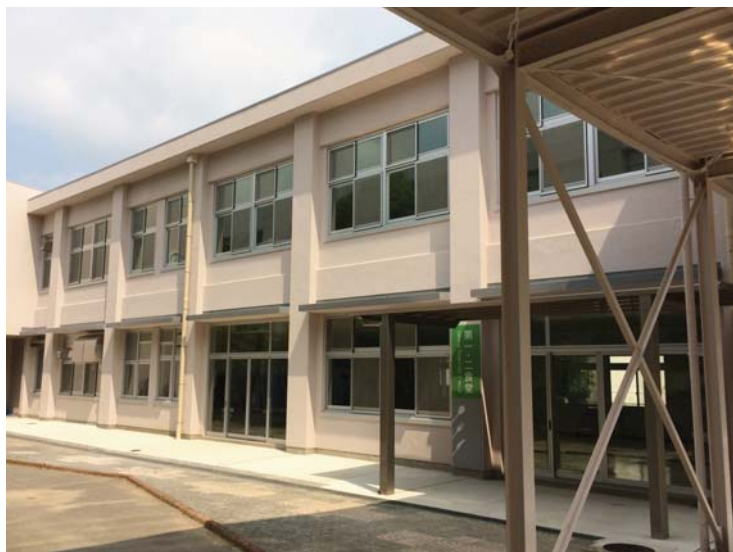
附属岡崎中学校給食室