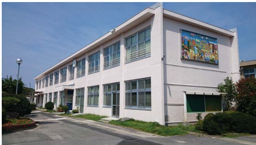
附属特別支援学校 中学部校舎