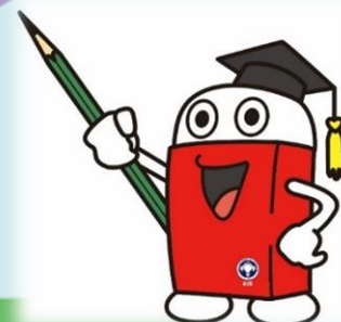
消しゴム「エディ」 Eraser "Eddy"