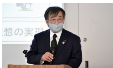
浅井厚視 氏(津島市教育委員会教育長)