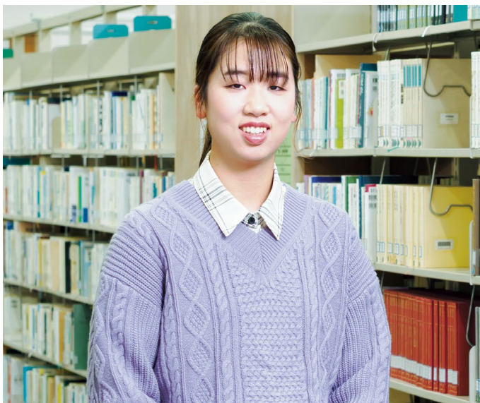
教育支援専門職養成課程 教育ガバナンスコース2年 私立栄徳高等学校出身