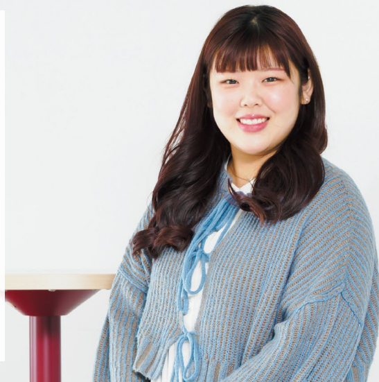
教育支援専門職養成課程 福祉コース3年 愛知県立豊橋南高等学校出身

福祉分野で興味のある事柄やニュースを深く学び、自分の意見を持つようにしました。共通テスト対策では過去問を繰り返し勉強し、満足のいく点数を目指しました。友人と励まし合い、先生から温かい指導を受けながら、受験の苦しさを乗り越えることができたと思います。