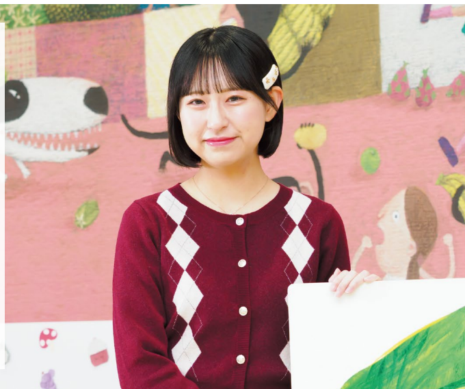
学校教員養成課程 幼児教育専攻3年 愛知県立名古屋南高等学校出身

共通テスト後は、小論文の練習と実技試験対策に力を入れました。保育の場面の絵をたくさん描いたり、幼児向け教育番組を観て表現力を磨いたり、高校の音楽の先生に課題曲を指導してもらいました。試験では「自分自身が楽しむこと」を意識し、最後まで自分を信じて挑みました。