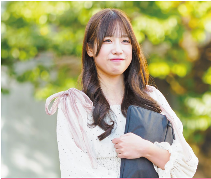
教育支援専門職養成課程 心理コース2年 愛知県立一宮西高等学校出身