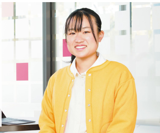
学校教員養成課程 算数・数学専修3年 愛知県立春日井高等学校出身

苦手科目をなくすことを意識し、夏休みには計画表を作り優先順位をつけて克服しました。英語は毎日リスニング、数学は記述対策を中心に練習。推薦対策では先生方に何度も志望理由書や面接練習をしてもらい、仲間とアドバイスをしながら力を伸ばしました。過去問にも取り組み、ノートにまとめて試験に臨みました。