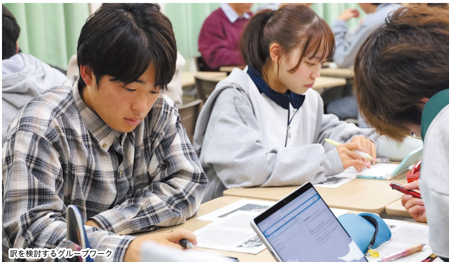
取を検討するグループワーク