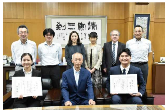
学生表彰受賞学生の表彰式