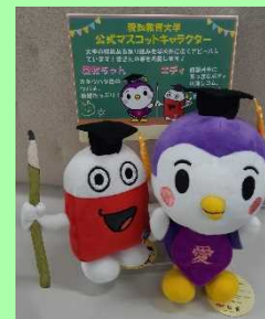
ご寄附いただいた方へのお礼品 (10万円以上ご寄附の方)