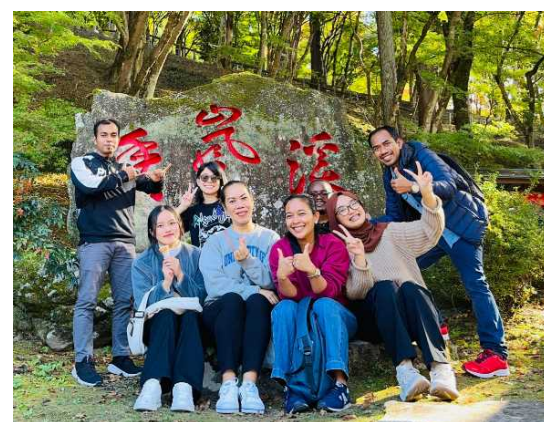
留学生の交流の様子