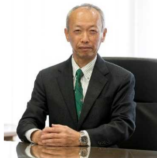
国立大学法人愛知教育大学長

社会に貢献できる有為な人材を育成するためには、学習環境づくりやカリキュラムの工夫のみならず、学生への修学支援や国際交流による多文化理解などが必須であります。本学の財政は、国からの運営費交付金や学生の授業料等によって賄われておりますが、更なる財源が必要であり、広く内外の皆様方からのご寄附を募り、財政基盤の強化・拡充を図りたいと考えております。つきましては、何卒本趣旨をご理解いただき、格別のご協力を賜りますようお願い申し上げます。