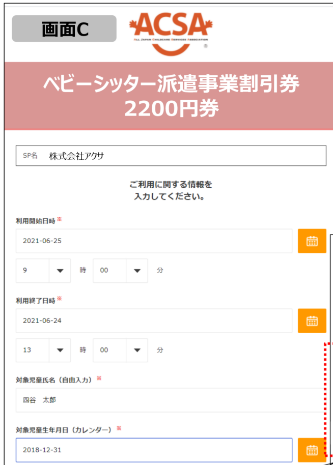
利用情報登録画面